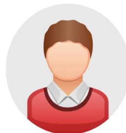
Reporte Representante Legal